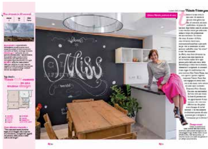
casa del mese su “Home” di Luglio 2017