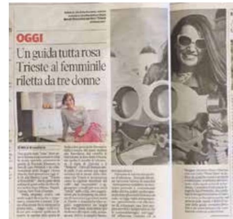
articolo su il Piccolo di Trieste, 17 maggio 2017